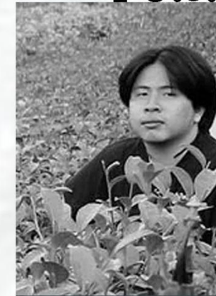
ประธานงาน